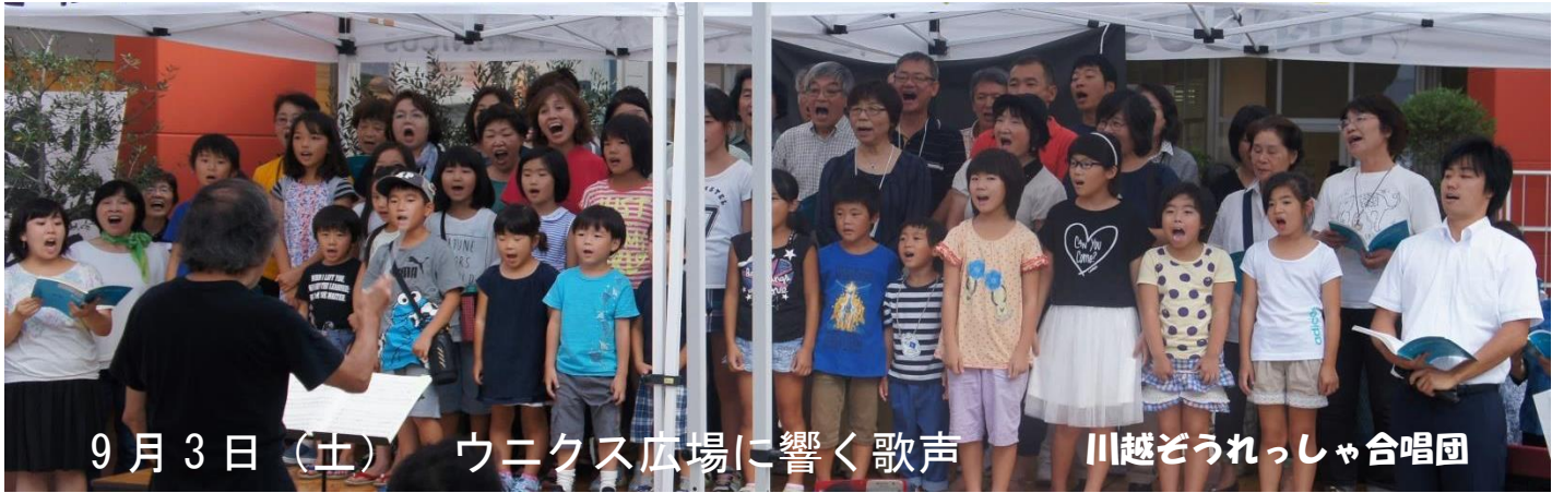
9月3日（土）ユニクス広場に響く歌声 川越ぞうれっしゃ合唱団